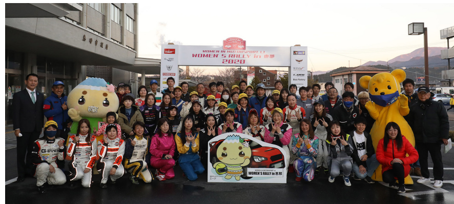
WOMEN'S RALLY in 恵那 2020 2020/12/5~6