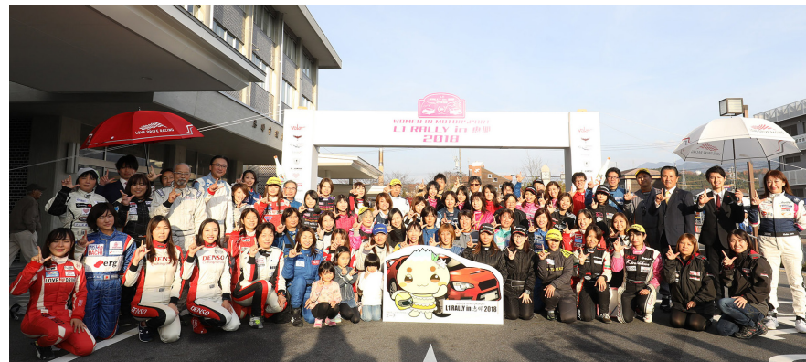
L1 RALLY in 恵那 2018 2018/12/1~2