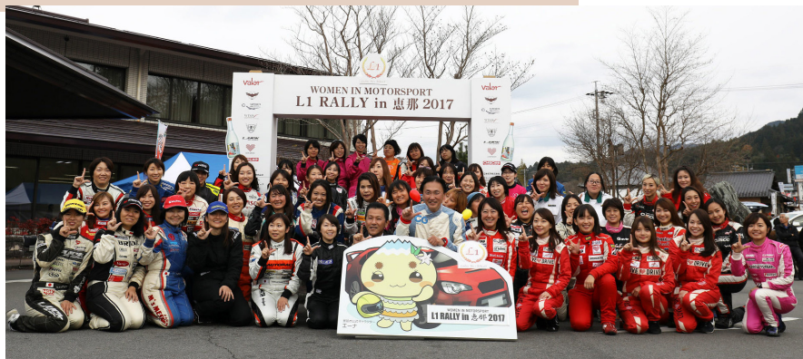
L1 RALLY in 恵那 2017 2017/11/25~26