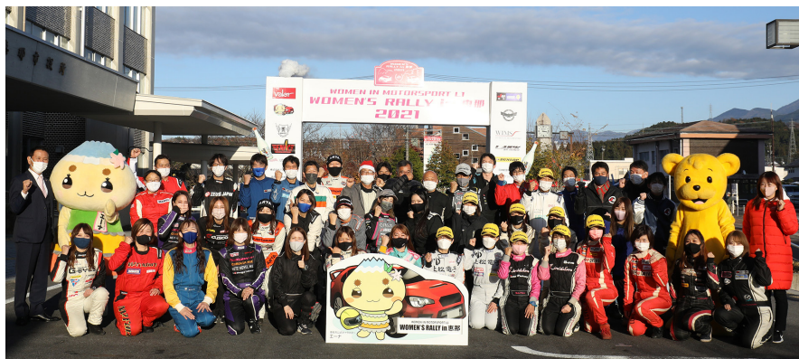
WOMEN'S RALLY in 恵那 2021 2021/12/4~5