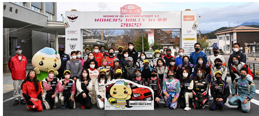
WOMEN'S RALLY in 恵那 2022 2022/12/3~4