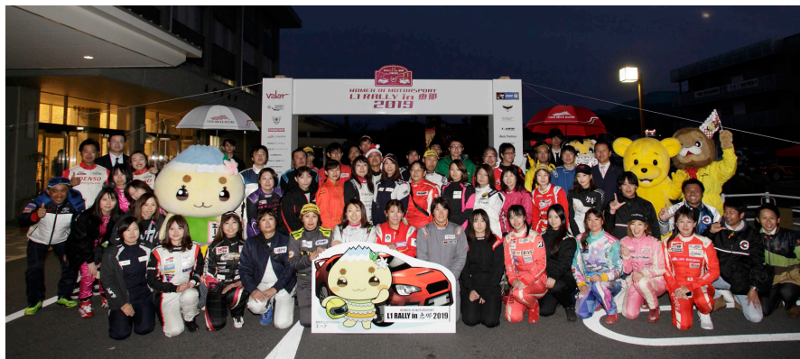
L1 RALLY in 恵那 2019 2019/11/9-10