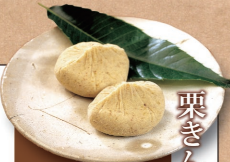
栗きんとん 火を通した栗をひとつひとつ手でくりぬき、砂糖と合わせてじっくり炊き上げ、また一つずつ手しぼり。二つと同じ形がない手づくりの栗菓子です。