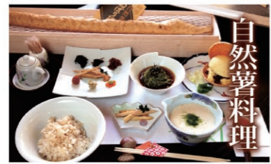
自然薯料理 独特の粘りと土の風味が特徴の山芋。滋養強壮に良い山里の高級珍味です。