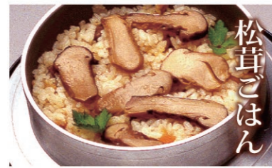
松茸ごはん 香り豊かな松茸と一緒に炊き上げたご飯。秋の味覚として地元の料理店で味わえます。