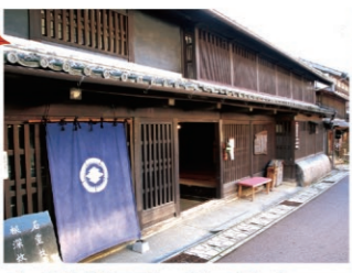
岩村城下の町並み

明知鉄道岩村駅から城跡方面に延びる本通りは、往時の面影を色濃く残す商家の町並みとして、国の「重要伝統的建造物群保存地区」に選定されています。