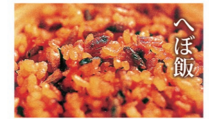
へぼ飯 地蜂の幼虫を甘辛く煮込んだ保存食。動物性たんぱく質がたっぷりです。