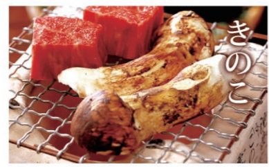
きのこ 香りと歯ごたえがとびきり素晴らしい松茸をはじめ、山でとれたばかりの新鮮なきのこが様々な調理法で楽しめます。