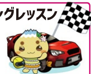
恵那市公式キャラクター 「エーナ」

WOMEN'S RALLYの、スペシャルステージとなる コースでモータースポーツ界トップドライバー講師陣に よるアドバイスなど、初心者から上級者までが、 ドライビングテクニックのスキルアップを図れます。